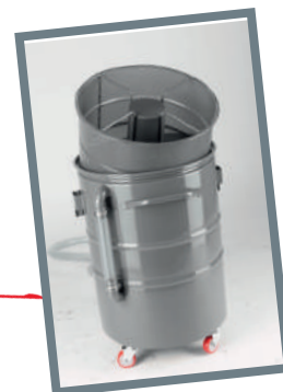
Contenitore a sgancio per svuotamento rapido con cestello grigliato per filtrazione trucioli e flotteur integrato Sieve grid for metal chip filtration with detachable container for fast discharge and floating device